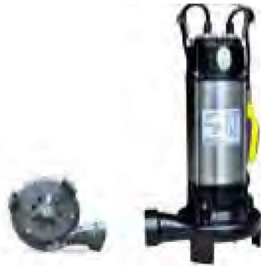
ETN DP (BIÇAKLI TİP)