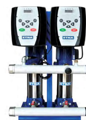
2 FM SERİSİ