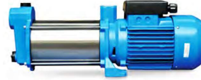
ETN YP SERİSİ