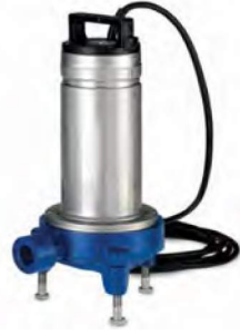
DOMO GRI SERİSİ (BIÇAKLI TİP)