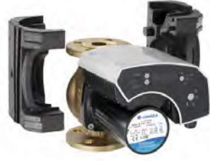
ECOCIRC XL/XL PLUS