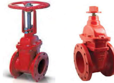
OS&amp;Y VE NRS YÜKSELEN MİLLİ VANA