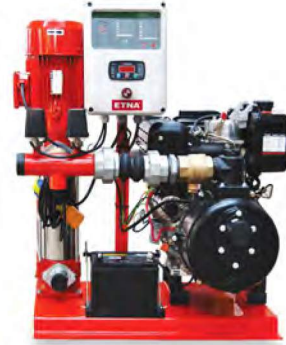
Y-KO + Dizel(Dik) SERİSİ