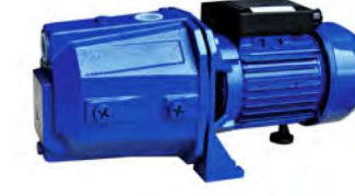
ETN JET SERİSİ