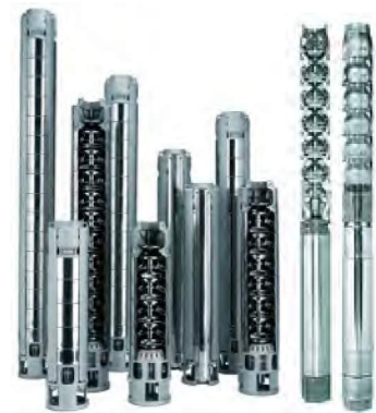
ZN6 - ZN8 SERİSİ