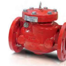
SWING ÇEK VANA