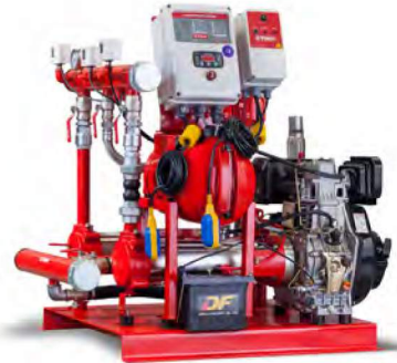
Y-KO + Dizel(yatay) SERİSİ