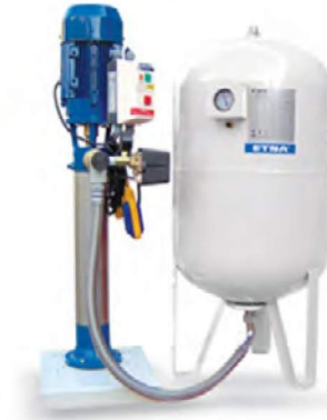
T1 EPH B-C SERİSİ