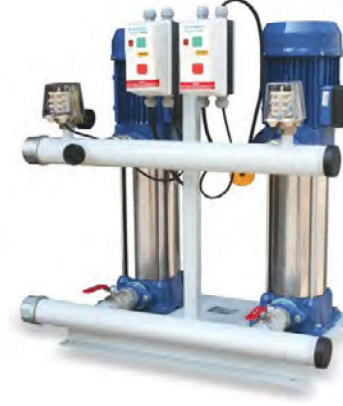
T2 EPH M-C SERİSİ