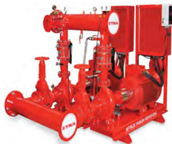
NFPA 20 SERİSİ