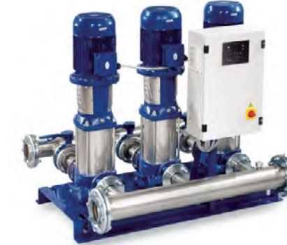
GV S- eSV SERİSİ