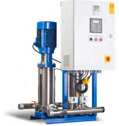
2 KI SERİSİ