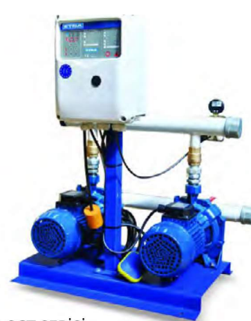
2 SCT SERİSİ