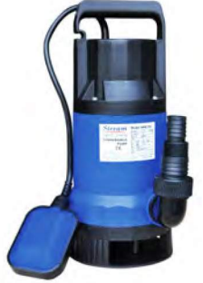
ETN T &amp; K SERİSİ