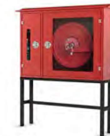
SAHRA TİPİ YANGIN DOLABI