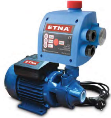
MİNİ HİDRO SERİSİ