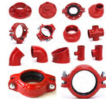
YANGIN EK PARÇALARI