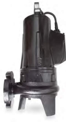
ETN 1000 & 1200 DP (BIÇAKLI TİP)