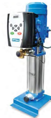
1 FM SERİSİ