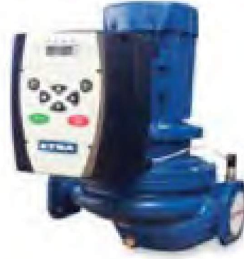
EIL R FK SERİSİ