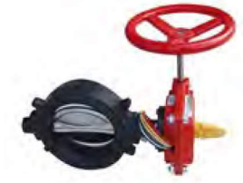
İZLEME ANAHTARLI KELEBEK VANA