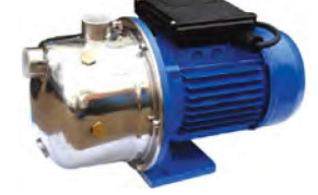
ETN JET INOX SERİSİ