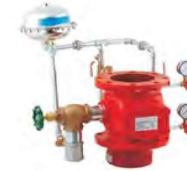
ISLAK ALARM VANASI