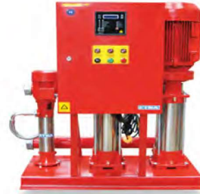
Y2KO + B-C SERİSİ