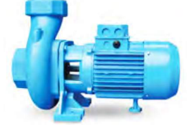
ETN TRS SERİSİ