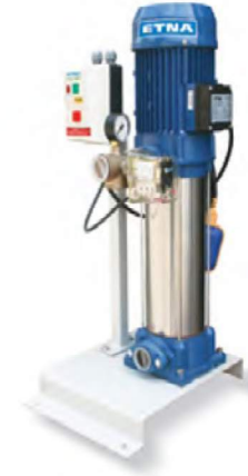
T1 EPH M-C SERİSİ