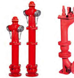
YER ÜSTÜ VE YER ALTI YANGIN HİDRANTI