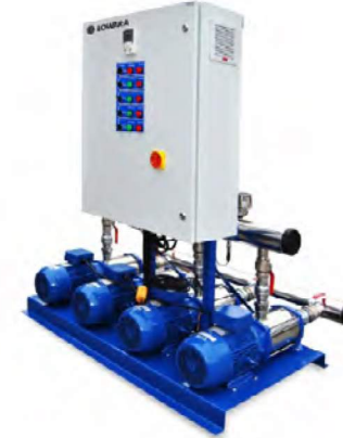
GM - eSV SERİSİ