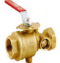
TEST DRENAJ VANASI