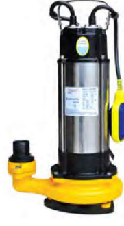
ETN D SERİSİ