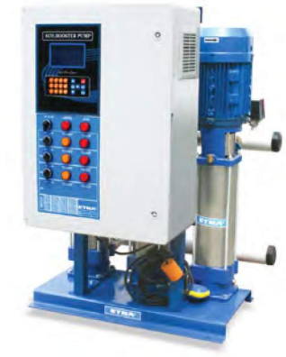
2 PFK SERİSİ