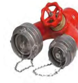
İTFAYE DOLUM AĞIZI