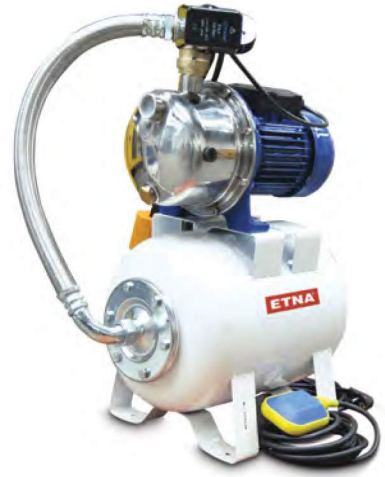
JET INOX SERİSİ