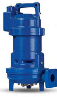
EFP - 30 (BIÇAKLI TİP)