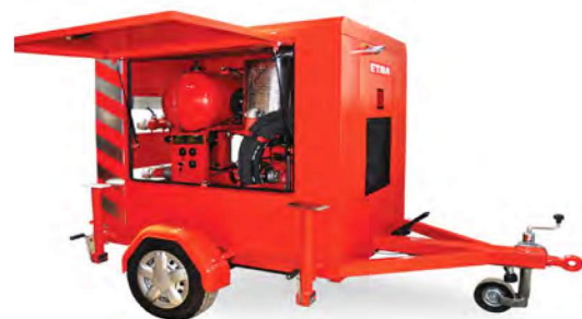
MOBİL YANGIN SÖNDÜRME VE SU BASKINI BOŞALTMA POMPASI