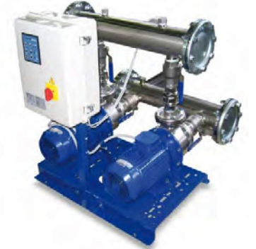
GM - eSH SERİSİ