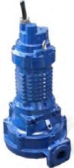
FDLT SERİSİ (BIÇAKLI TİP)