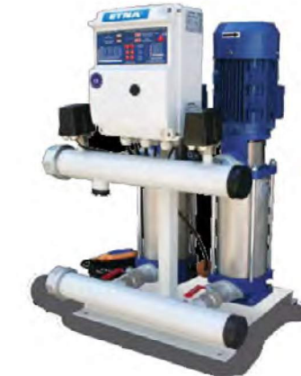
2 KO SERİSİ