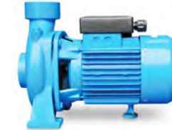
ETN SCT SERİSİ