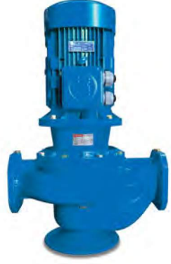
EIL R SERİSİ